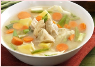
Sop sayur ayam